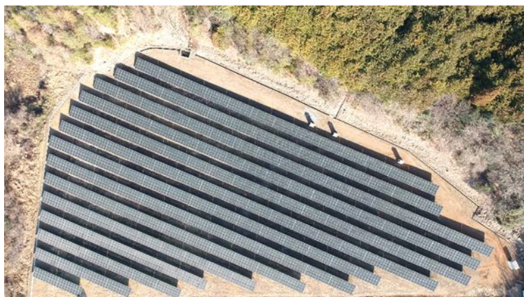
岐阜県美濃市立花

(注1) PPA サービス(Power Purchase Agreement、電力購入契約)。発電事業者が、需要者の敷地内に太陽光発電設備を無償で設置、所有・維持管理した上で、発電された電気を需要者に販売するしくみ。